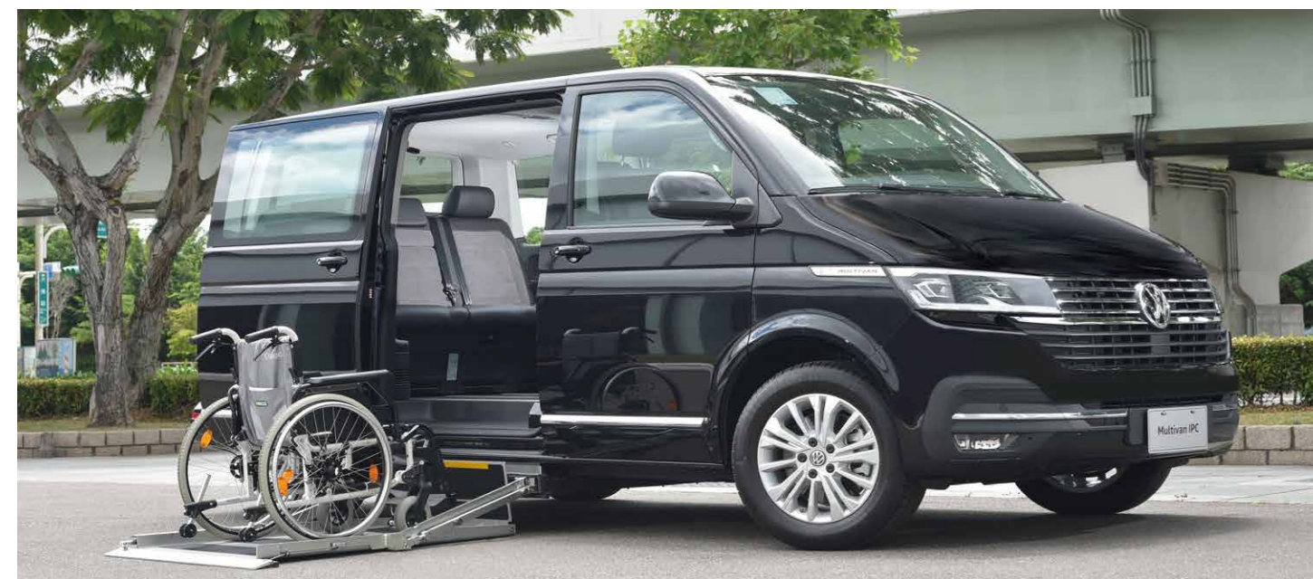
* 特殊車側艙匣電動升降裝置，可讓輪椅乘客經由電動滑門安心進出車輛(可承載300公斤)。

搭載歐洲最大輔具製造廠商德國AMF-Bruns公司專為輪椅乘客設計的輪椅安全套件，為國內唯一通過法規認證的車側艙匣電動升降設備。