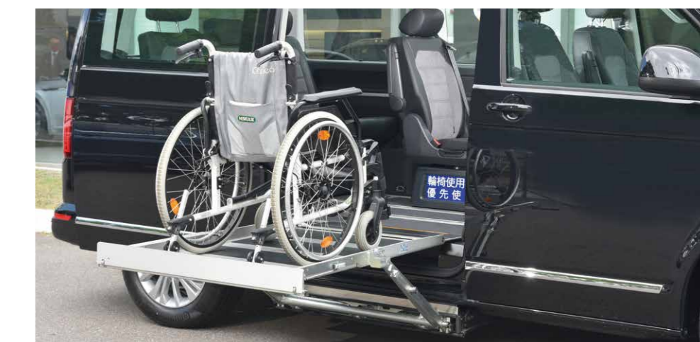
* 較大升降平台，運行平穩。(內裝以實車為準)