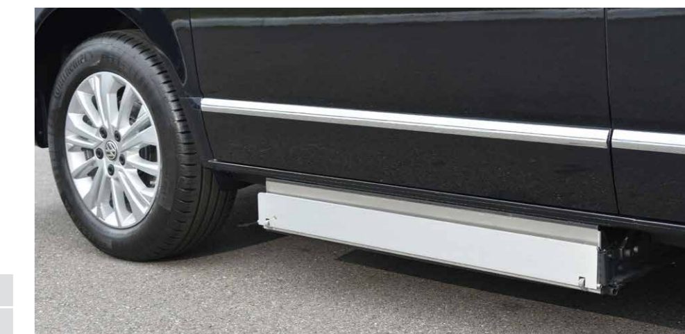
* 超薄艙匣機體設計，升降機收納於不銹鋼匣中，隱密收納，增加距地高度。