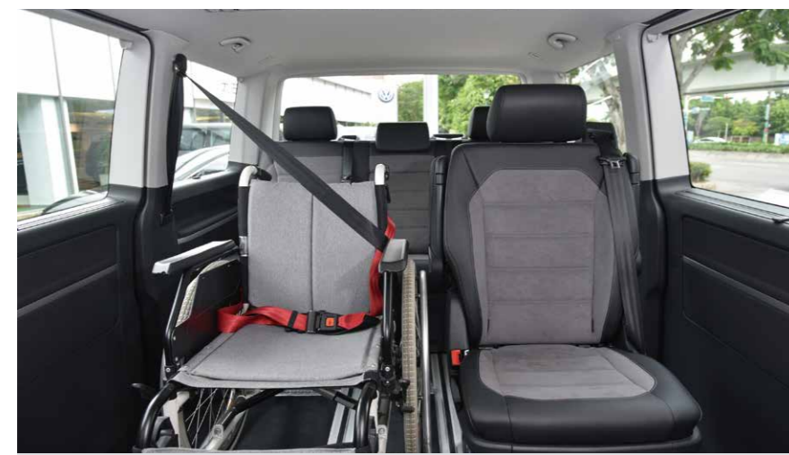
* 將輪椅安全固定於車輛中心，方便照顧輪椅乘客。(為座位配置示意圖，內裝以實車為準)