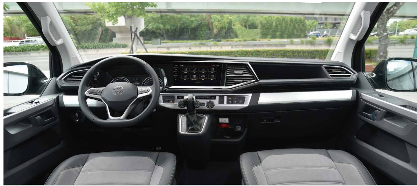
豪華的駕駛艙及頂級資訊娛樂系統，讓車內所有乘客都可享受最舒適的座艙環境。(內裝以實車為準)