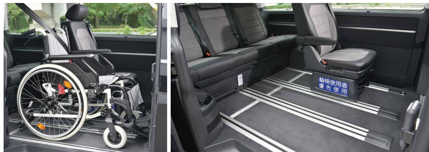
保留原車無段式滑軌系統，車輛內裝不變，靈活變化豪華舒適，可依需求創造不同的座位配置。(為座位配置示意圖，內裝以實車為準)