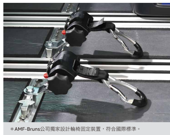
* AMF-Bruns公司獨家設計輪椅固定裝置，符合國際標準。