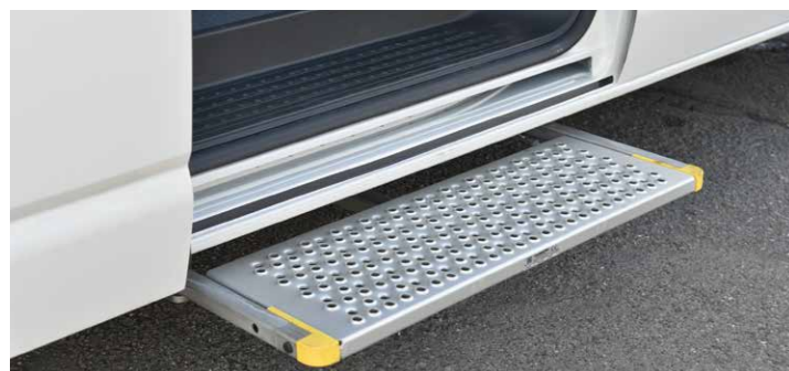
* 德國進口AMF-Brunns電動伸縮踏板