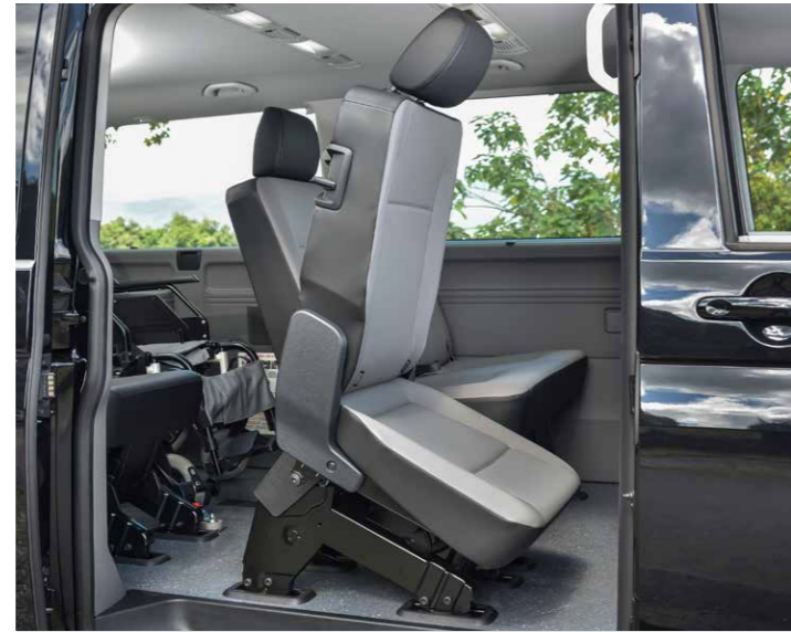
Easy Entry簡捷上車功能 (Kombi 長軸平頂座位配置示意圖，內裝以實車為準)