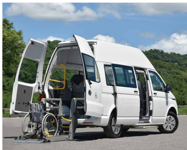
乘客艙高度192公分 * 德國進口AMF-Brunns Split升降機

Kombi 福祉車配備雙前座SRS氣囊、ESC電子行車穩定系統及MCB二次撞擊預煞系統等安全科技，並搭載歐洲最大輔具製造商德國AMF-Brunns公司、通過歐盟認證標準的輪椅套件，以最完整的保護提供最高規格的行車安全。