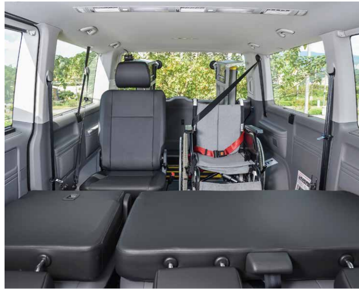
* 8人座車型配置7位乘客及1位輪椅乘客 (Kombi 長軸平頂座位配置示意圖，內裝以實車為準)

以德國福斯商旅安全可靠的Kombi車款開發，提供舒適的行車感受及創新的引擎科技；全新的節能引擎帶來的省油效能，搭配七速DSG自排手排變速系統，提供7人座或8人座車型符合不同載運需求。