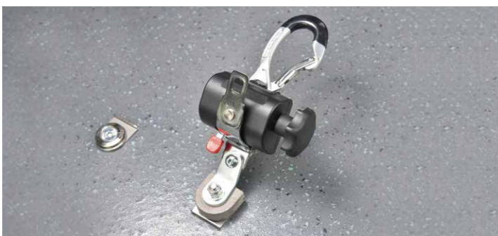
* 易拆卸&安裝輪椅固定裝置