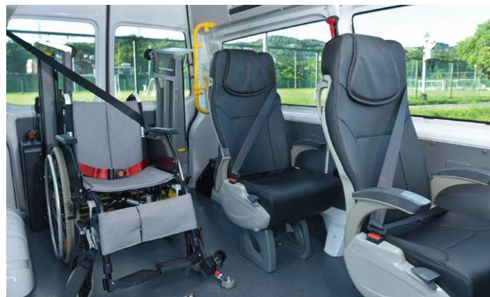
* 7人座車型配置2張獨立座椅及1座折疊椅 (Kombi 長軸高頂座位配置示意圖，內裝以實車為準)