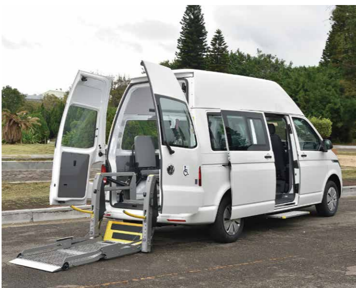
乘客艙高度192公分 * 德國進口AMF-Brunns Panorama升降機