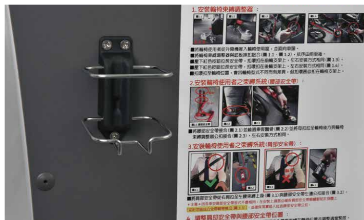
* 乘客艙獨立置杯架