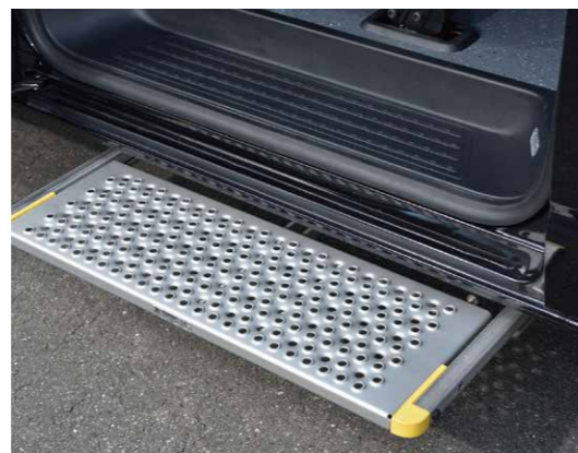
* 德國進口AMF-Brunns電動伸縮踏板