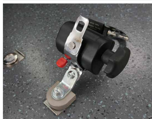
* 易拆卸&安裝輪椅固定裝置