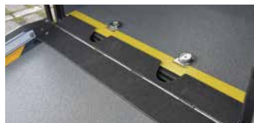
* AMF-Bruns 獨家設計斜坡跨板