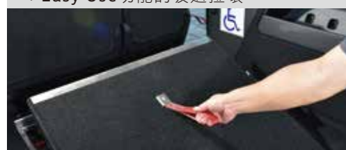
* Easy Use功能的坡道拉環