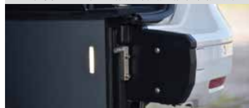
* 柔和暖色調的坡道LED照明燈