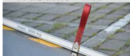
* Easy Use功能的坡道拉環