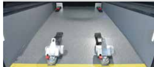
* 榮獲2020年紅點設計獎的輪椅固定裝置